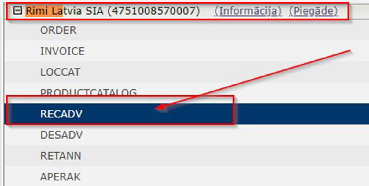
Zīm. 14. Sadaļa: “ATTIECĪBAS” – “RECADV”

Pēc preču piegādes dokumenta nosūtīšanas, mazumtirdzniecības tīkls nosūtīs Jums aktu par pieņemto preci, kuru Jūs varēsiet apskatīt sadaļā: “ATTIECĪBAS” – “RECADV” (zīm.14.).